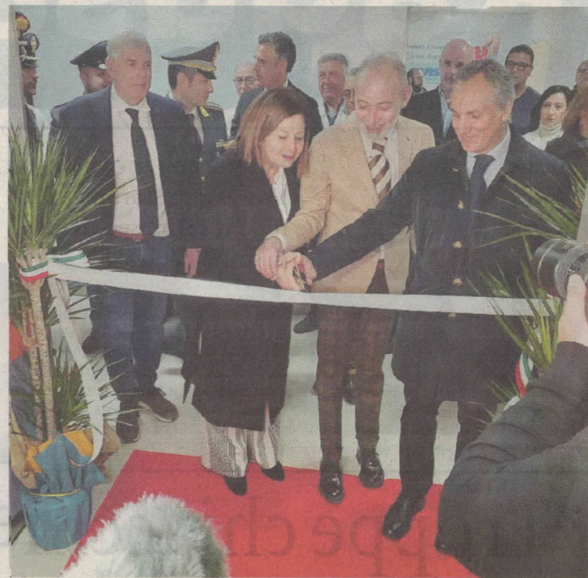
Il taglio del nastro con questore, prefetto e commissario Asp