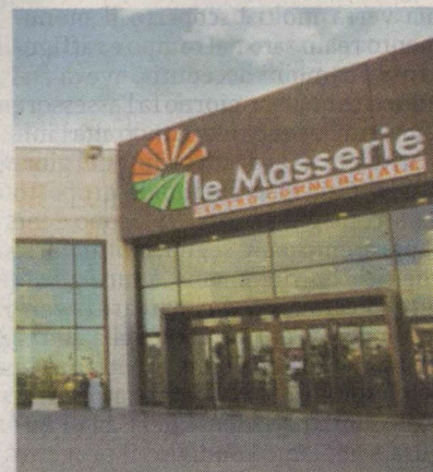
Il centro commerciale

tazioni per ciò che concerne le festività natalizie. La Fisascat Cisl ha proposto un protocollo d'intesa contenente sempre più linee guida per il rispetto del Ccnl e quindi del lavoro festivo e domenicale che, in buona parte, risulta già essere regolamentato dal contratto collettivo. Questo ci porta ad affermare che la problematica da risolvere riguarda non soltanto le chiusure festive ma anche e soprattutto tutto quello che concerne i rapporti di lavoro e il rispetto degli stessi. Ringraziamo la direzione de Le Masserie per avere avviato questo dialogo perché riteniamo che soltanto così si potrà arrivare a definire soluzioni valide».