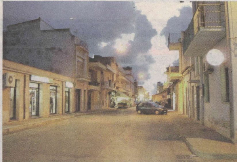
Un tratto della via Roma a Vittoria dove si è verificato l'incredibile episodio

A seguito dell'aggressione subita dalla vittima, che, per fortuna, non ha avuto conseguenze estreme, la polizia aveva avviato immediatamente un'attività di indagine, coordinata dalla Procura della Repubblica presso il Tribunale di Ragusa, con l'ausilio degli agenti della Scientifica, acquisendo numerose