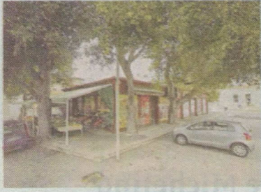
La baracca di piazza Cappellini

VITTORIA. Il sindaco, Francesco Aiello, ha accordato la proroga dello sgombero della piazza Cappellini, dove da anni si trova una baracca per la vendita di frutta e verdura. La notizia è stata diffusa dal Comune nella sua pagina Facebook. Nel post, l'Ente spiega che la decisione è stata assunta dal primo cittadino "su richiesta degli interessati e dopo avere verificato le reali esigenze degli stessi. Pertanto - si legge ancora - la data per l'effettuazione dello sgombero sarà il 31 gennaio 2023 anziché il 30 novembre prossimo. Questa proroga consentirà ai gestori di trasferire il punto vendita dalla stessa piazza in un locale di proprietà degli stessi, in fase di ultimazione dei necessari lavori edili". La notifica dell'ordinanza di sgombero era stata fatta dalla polizia municipale di Vittoria lo scorso agosto. Lo stesso Comune, in quell'occasione, aveva precisa-