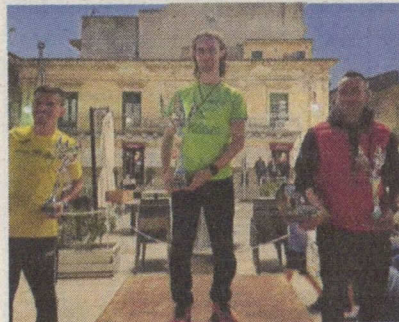
Noto, Amenta e Sammatrice