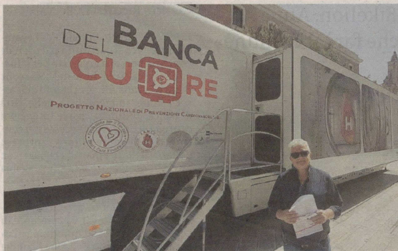
Il Truck tour Banca del cuore da domani sarà a Vittoria fiera Emaia

«Grazie al progetto Banca del Cuore, ideato e coordinato dal prof. Michele Gulizia per la fondazione per il Tuo cuore - è spiegato ancora - a tutti i cittadini che arriveranno al Truck verrà consegnata una BancomHeart personale, una card unica al mondo che permette l'accesso 24 ore su 24 al proprio elettrocardiogramma, ai valori della pressione arteriosa, alle patologie sofferte, alle terapie assunte, agli stili di vita praticati e a tutti gli esami cardiologici e di laboratorio eseguiti».