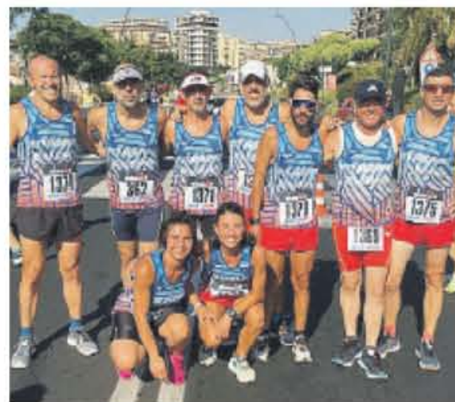
L'Ultrarunning Ragusa a Catania