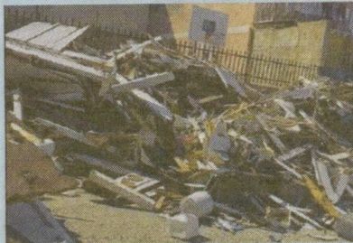
I rifiuti abbancati