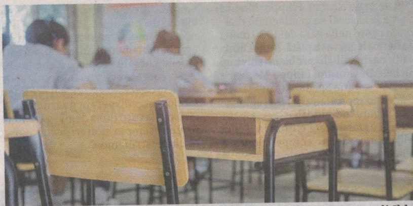
Il fenomeno della dispersione scolastica sempre più presente negli Iblei

«Intervento straordinario, quello del ministero, finalizzato alla riduzione dei divari territoriali nel I e II ciclo della scuola secondaria e alla lotta alla dispersione scolastica nell'ambito della Missione 4 - componente 1 - del Piano nazionale di ripresa e resilienza, finanziato dall'Unione europea - Next generation Eu. In elenco gli istituti di I e II grado che beneficeranno del contributo di 500mila euro per interventi di prevenzione e contrasto alla dispersione scolasti-