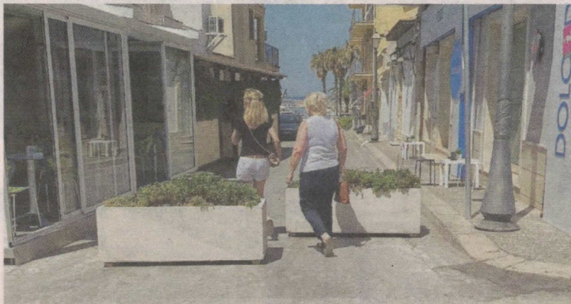
Alcune fioriere installate a protezione delle aree pedonali