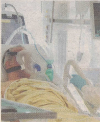
540 i decessi per Covid in provincia

Per quanto riguarda i dati del contagio, si registra un lievissimo calo dei positivi che scendono così a 3.124 (mentre ieri erano 3.125): 3.085 si trovano in isolamento domiciliare e 39