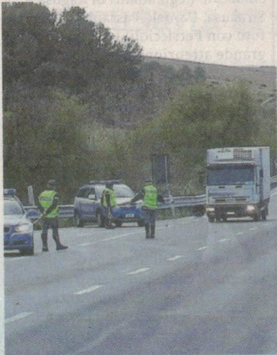
Un posto di blocco Polstrada

la guida in stato di ebbrezza alcolica. Lo scopo di questa campagna è quella di incrementare i livelli di sicurezza sulle strade e ridurre il numero di vittime da incidente stradale contro lo stato di alterazione per uso di sostanze alcoliche, in linea con le attività internazionali congiunte di controllo e contrasto delle violazioni, all'interno di specifiche aree strategiche e Relative campagne di prevenzione e di informazione, al fine di elevare gli standard di sicurezza stradale.