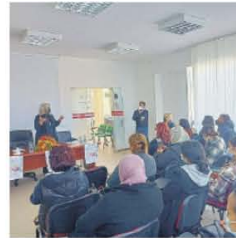
Confronto. Sopra, l'incontro tenutosi a Ispica e, nella foto a sinistra, quello che, invece, si è svolto a Vittoria.