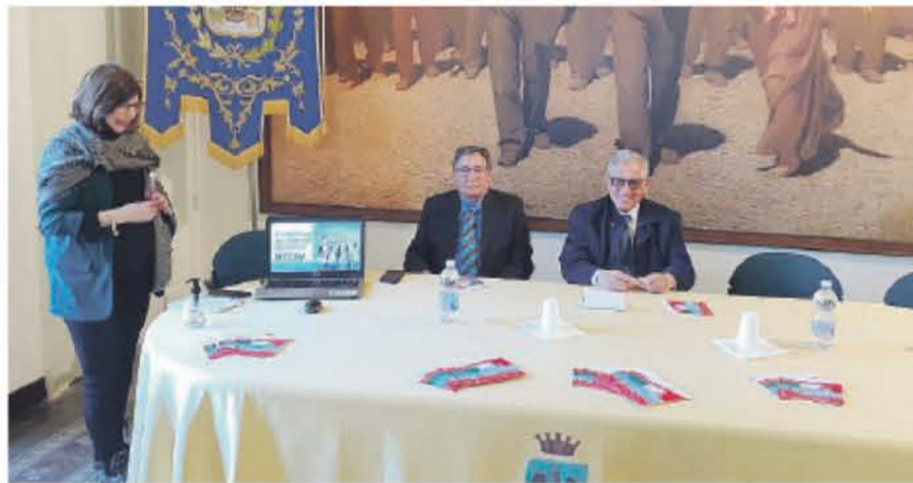
La conferenza stampa di ieri mattina nella sala Quarto Stato a palazzo Iacono