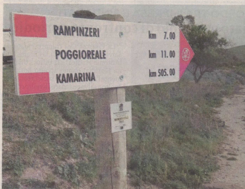
Alcune delle segnalatiche che sono state installate lungo il percorso

"La posa della segnaletica, che inizia dalla laguna dello stagnone di Mozia, a Marsala, prosegue nelle successive province fino a raggiungere Ragusa, attraversando 54 Comuni, 6 parchi archeologici, lungo un percorso di circa 650 chilometri" aggiungono annotando che "ultima tappa sarà proprio Kamarina, città dove l'Antica Trasversale sicula ipotizzata dall'archeologo Biagio Pace è stata riscoperta ed è stato lanciato il progetto del cammino" precisa l'associazione. "Un totale, dunque, di 850 segnali tra tabelle e frecce, in legno, indicheranno al camminatore il sentiero corretto soprattutto in quei punti in cui possono sussistere dei dubbi sull'itinerario da seguire per arrivare alla meta finale ma faranno anche da guida da occidente ad oriente, e viceversa, indicando l'esatto percorso; infine nei paletti è posto un cartello con il logo M5s da cui, tramite il "concorso di idee", proviene il finanziamento che ha permesso la realizzazione dell'intera segnaletica.