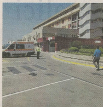
La situazione. Ancora una vittima a causa del covid. E' morta una 86enne di Pozzallo. Il decesso è avvenuto nel reparto di Malattie infettive dell'ospedale Maggiore di Modica (nella foto sopra).