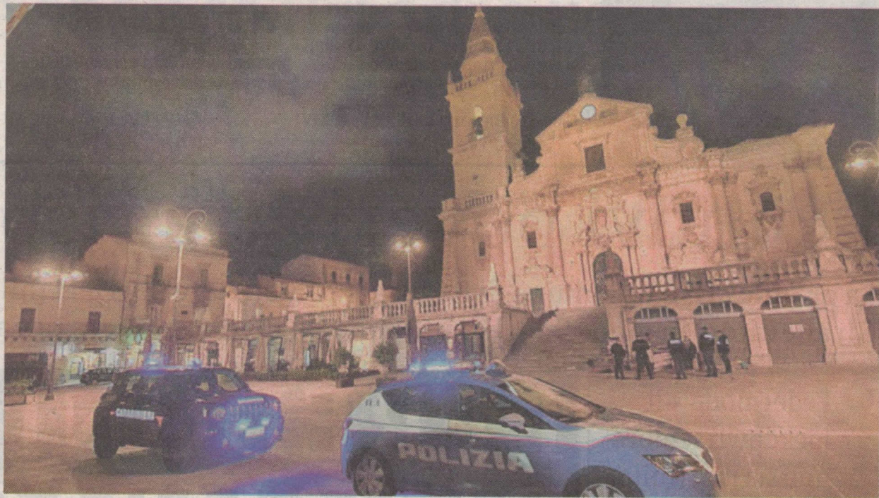
L'operazione è stata condotta in maniera congiunta da polizia e carabinieri. A sinistra, una delle aree interessate.

I cinque non hanno opposto resistenza e sono stati condotti presso il commissariato di Modica per gli accertamenti e le pratiche di rito conseguenti all'arresto. Su disposizione dell'autorità giudiziaria di Ragusa sono stati poi tradotti presso il carcere di via Di Vittorio. Il brillante risultato conseguito dalle forze dell'ordine di Ragusa sottolinea ancora una volta l'attiva e attenta presenza sul territorio, nell'interesse di tutelare i cittadini. «I miei complimenti a polizia e carabinieri per aver portato brillantemente a termine un'operazione importante che ha sgominato la pericolosa banda criminale che aveva seminato il panico tra i residenti di c.da Mauto e Frigintini», ha detto il sindaco di Modica, Ignazio Abbate, all'indomani dell'operazione. «A nome di tutti i cittadini li ringrazio per il prezioso lavoro che svolgono ogni giorno per garantire la nostra serenità».