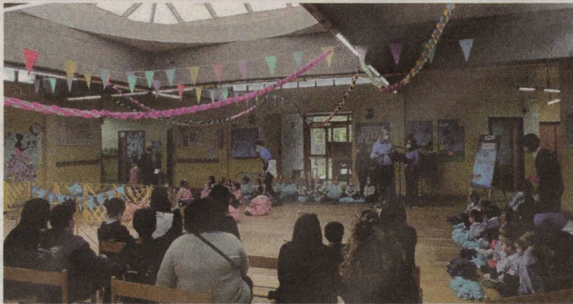
L'appuntamento tenutosi nella scuola Che Guevara di Vittoria

A Vittoria, nell'ambito del progetto "Inclusione sociale dei bambini e dei