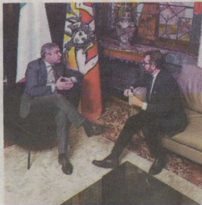
Scilla e Cugnata di Forza Italia

Scilla, accompagnato da Cugnata, sarà giorno 7 ad Ispica per incontrare il sindaco e giorno 8 mattina visiterà il mercato ortofrutticolo di Vittoria per incontrare produttori