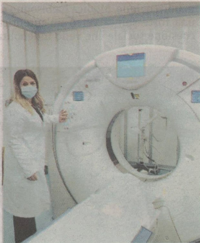
La foto generica di una Tac

«Si lamenta - scrivono ora dall'Asp - l'uso di una Tac privata posta a circa 200 metri di distanza dall'ospedale per il tempo utile all'installazione della nuova. La Tac non è un elettrodomestico qualsiasi da collegare ad una presa elettrica, ma va calibrata per alcuni giorni, sperimentata e infine collaudata per garantire una diagnosi corretta e un uso sicuro. Ad oggi, sono stati effettuati nello studio privato circa 50 esami in cinque giorni che hanno evitato il trasporto di pazienti,