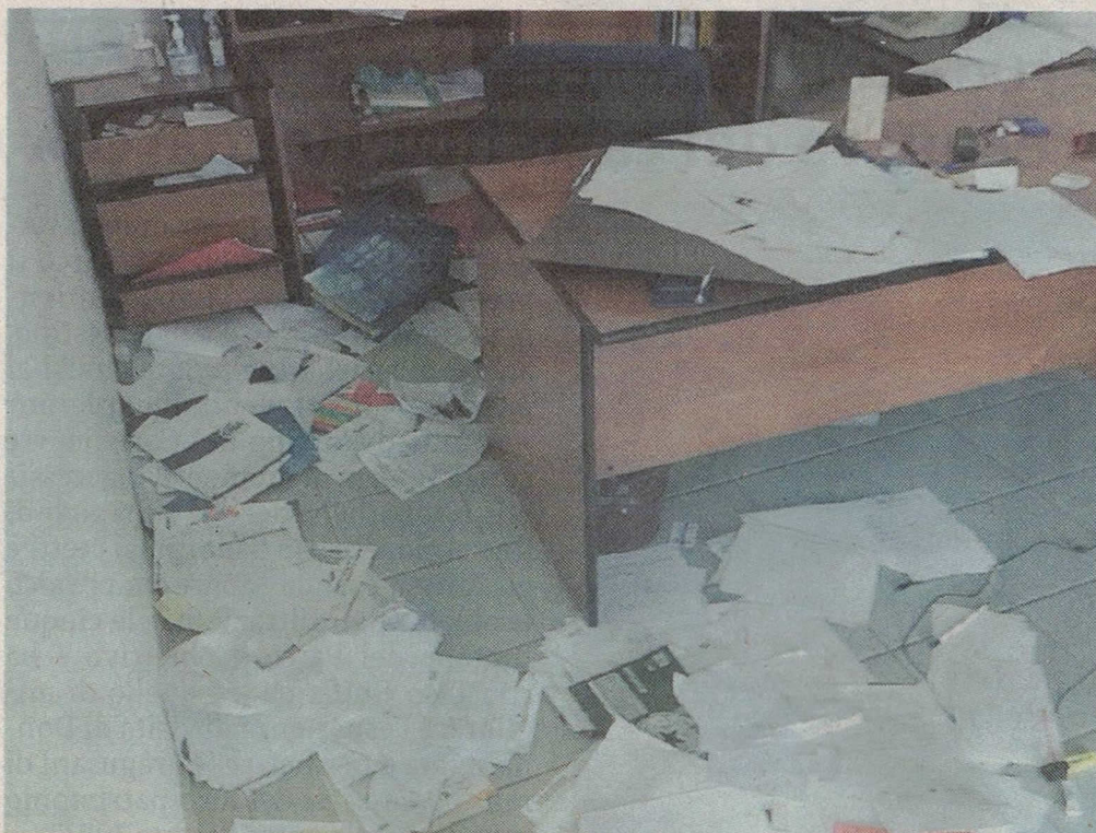
L'interno della sede Cna e, sopra, la polizia nella sede della Cgil