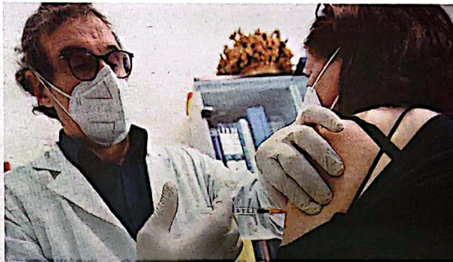
La campagna vaccinale continua a segnare il passo per una serie di motivi

E a proposito di tamponi, nella giornata del 19 marzo sono stati 2255 gli screening effettuati in provincia di Ragusa con il risultato di 610 positivi riscontrati. De test antigenici rapidi, 569 sono stati eseguiti nei drive-in straordinari della provincia