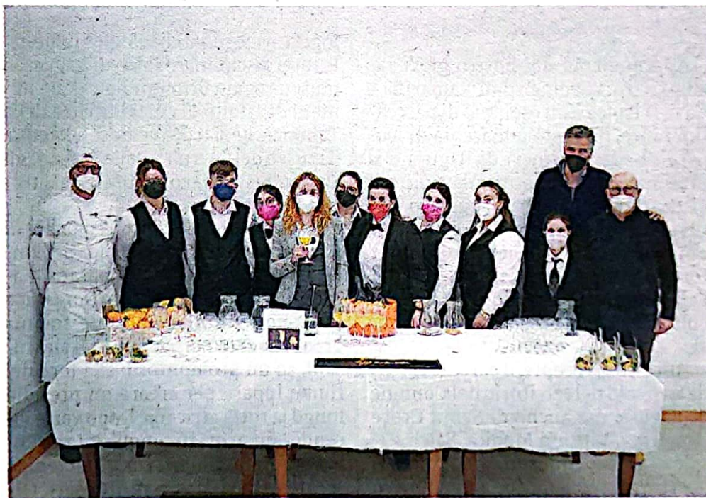
L'incontro tra l'arancia rossa di Sicilia Igp e gli studenti del Marconi

«Siamo rimasti favorevolmente sorpresi dal modo in cui l'Arancia Rossa di Sicilia Igp sia stata fatta diventare la protagonista assoluta delle diverse attività laboratoriali dell'istituto" conclude il presidente del Consorzio di Tutela Arancia Rossa di Sicilia Igp più che mai convinto che sia stata una mossa vincente avere incontrato la straordinaria realtà del Marconi di Vittoria. Prossimo appuntamento con la Carota Novella di Ispica Igp. ●