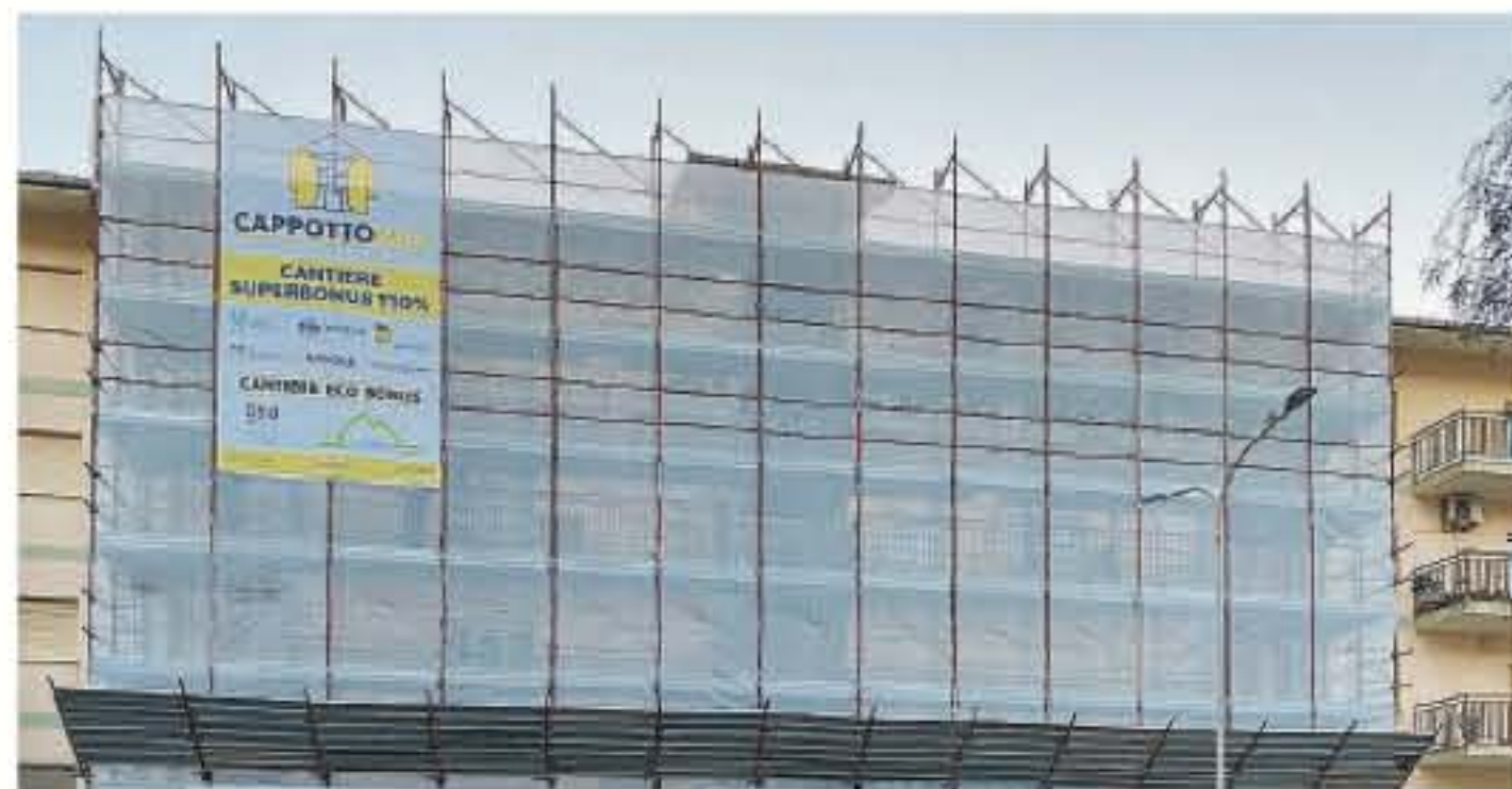
L'intesa sul Superbonus a tutela di imprese e lavoratori

«La norma - prosegue Ance insieme a Cgil, Cisl e Uil - garantendo formazione e più sicurezza tutela e premia i lavoratori e le imprese che rispettano i contratti e la legge. In Sicilia il settore, quasi per intero nel privato, è cresciuto nell'ultimo periodo per volume di affari di circa il 30%. E' questa la fase di cui bisogna tenere alto il livello di attenzione a tutela del buon lavoro e contro il rischio di