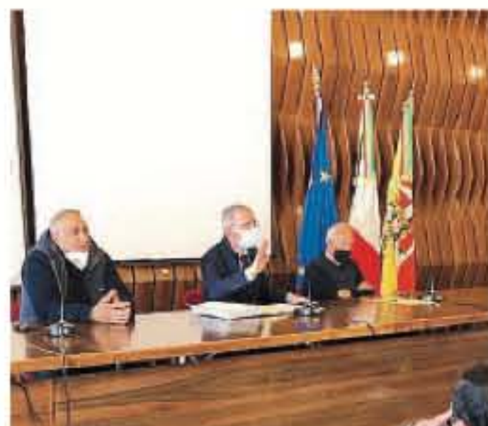
Verso la normalità. Sopra la riunione di Catania, in alto il blocco di giovedì sulla Scicli-Donnalucata.

Tavolo di confronto ieri mattina a Catania, presso la sede della Regione, per parlare con i rappresentanti delle categorie degli autotrasportatori e della grande distribuzione. Un momento di ampio dibattito e confronto rispetto al quale l'assessore regionale alle Infrastrutture e Trasporti, Marco Falcone, ha voluto ribadire l'attenzione del livello regionale rispetto alla protesta che ha previsto il blocco dei camion e poi il ritorno verso la normalità con la promessa di tentare un auspicato confronto con il livello nazionale.