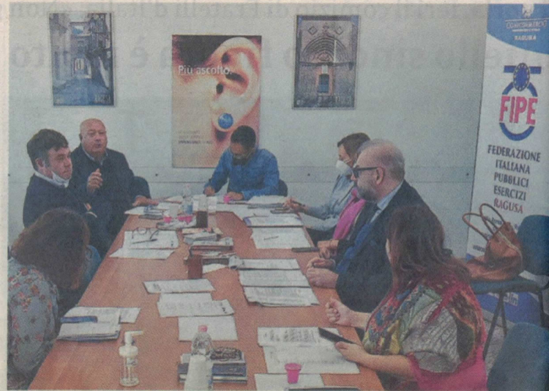
Una riunione dell'Ente bilaterale del terziario di Ragusa

Le certificazioni di esenzione, inoltre, è spiegato ancora, dovranno essere sempre aggiornate e quindi revocate nei medesimi casi previsti per le certificazioni verdi (come la sopraggiunta positività dell'interessato o l'acquisizione fraudolenta), nonché qualora venga meno la specifica condizione clinica che ne ha giustificato il rilascio. Nella definizione del decreto particolare attenzione posta su una serie di delicati aspetti come le modalità di accesso al sistema Ts.