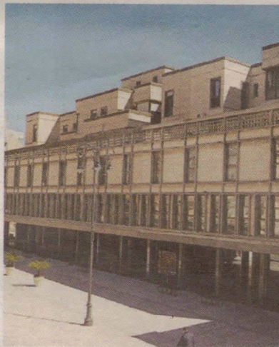
Palazzo ex Ina

RAGUSA. Da domani a sabato saranno sospese tutte le attività degli uffici giudiziari allocati al secondo piano del palazzo ex Ina di piazza San Giovanni sezione Lavoro e Previdenza - lato Nord corso Italia - per interventi di manutenzione dei solai, con conseguente divieto di accesso nei predetti uffici giudiziari per magistrati, dipendenti amministrativi ed utenti. Lo ha disposto il presidente del Tribunale facenti funzioni, Vincenzo Panebianco, alla luce della segnalazione dell'Ufficio Tecnico del Comune di Ragusa, ente proprietario dell'immobile, dopo un sopralluogo congiunto dei tecnici comunali e dei funzionari del Tribunale, con cui è stato segnalato il distacco di pignatte