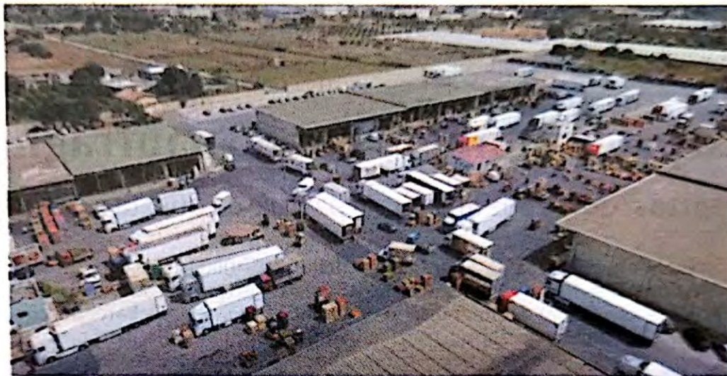
Il mercato ortofrutticolo di contrada Fanello