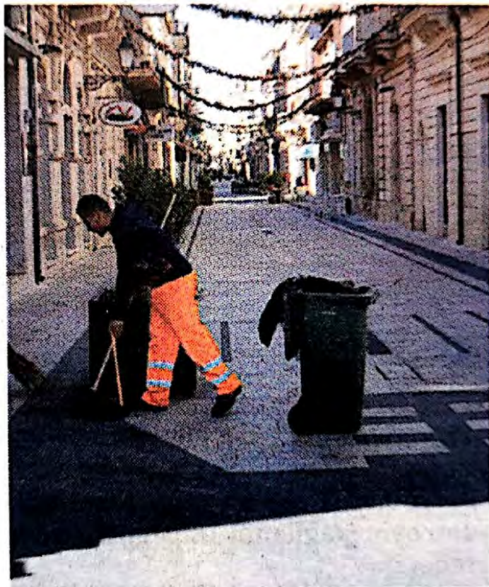
Operatori del settore all'opera