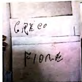
L'inchiesta. Sarà la magistratura ad appurare che cosa sia realmente accaduto in seno al Consiglio comunale sull'elezione del presidente e su quella del vice. Sopra, alcune schede.