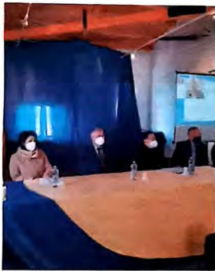
La conferenza stampa di ieri