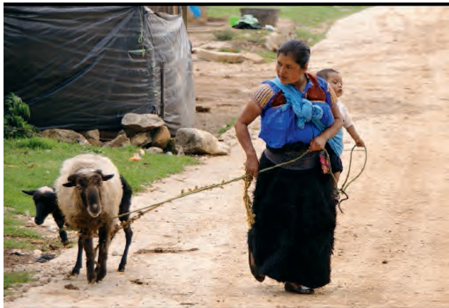
UNA DELLE IMMAGINI CHE SARANNO ESPOSTE NELLA MOSTRA DI EDOARDO CROCE