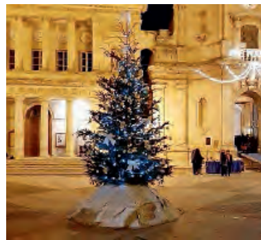
L'ALBERO DI NATALE SOLIDALE IN PIAZZA

Questi bambinelli, alcuni dei quali dormienti, sono veri e propri "sogni" sia per i collezionisti, sia per gli spettatori che contemplano queste opere. Questa attività costituisce una nuova occasione per far riscoprire le nostre tradizioni artistico-culturali che, a mio fermo parere, costituiscono il nostro punto di forza e devono costituire quello di partenza per educare anche le nuove generazioni al bello e all'ottimo estetico" precisa l'esperto al patrimonio artistico e culturale cittadino che, molto probabilmente, ha voluto chiudere con un evento significato il