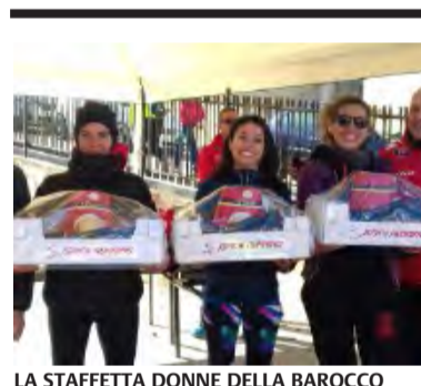
LA STAFFETTA DONNE DELLA BAROCCO