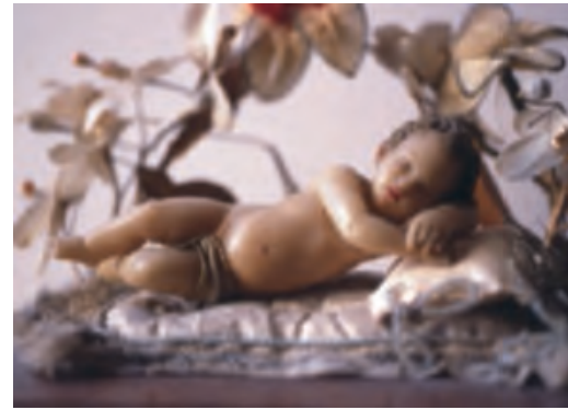
LA STORIA DEI BAMBINELLI. Sono realizzati in cera e con un passato tutto da scoprire al museo diocesano