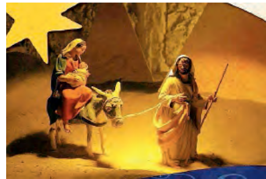
IL PRESEPE BIBLICO. L'idea è venuta alla comunità di San Giovanni, scenario Sant'Antonio abate