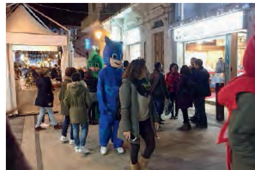
CENTRO E DINTORNI. Numerose le iniziative che hanno animato il Natale nelle zone del centro storico